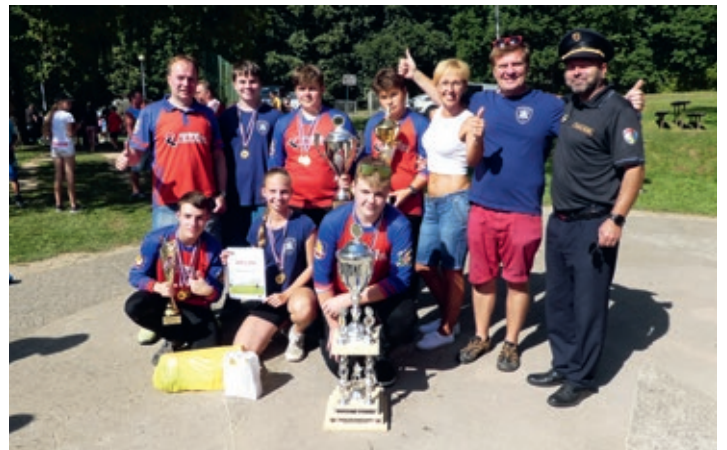
Družstvo starších žáků s pohárem