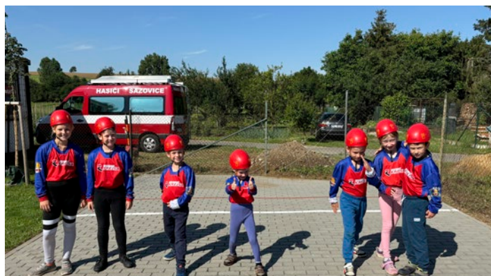
Družstvo mladších žáků v Sazovicích