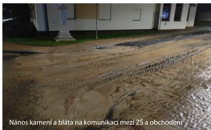
Nános kamení a bláta na komunikaci mezi ZŠ a obchodem