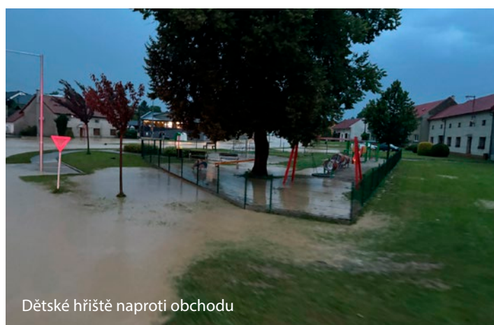
Dětské hřiště naproti obchodu