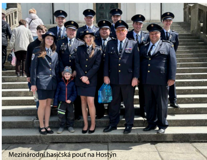
Mezinárodní hasičská pouť na Hostýn