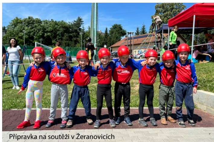
Přípravka na soutěži v Žeranovicích