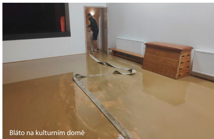
Bláto na kulturním domě

„Ještě jednou mockrát děkuji všem, kteří přišli nezištně pomoci spoluobčanům postiženým povodněmi,“ poděkoval starosta.