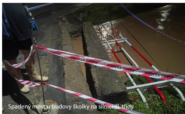
Spadený most u budovy školky na silnici III. třídy