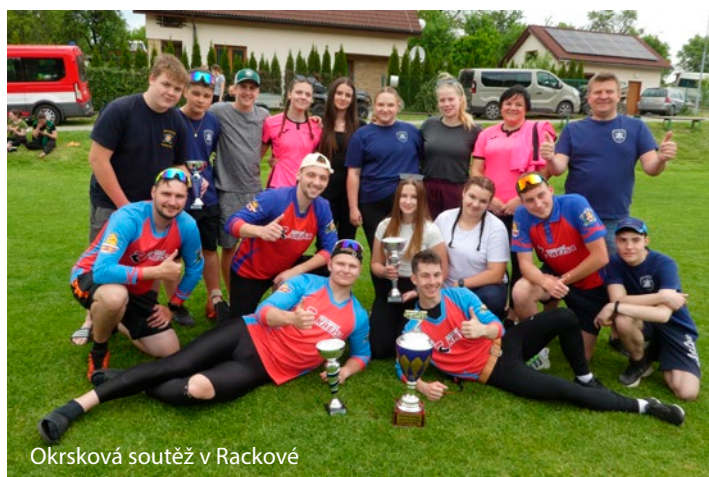
Okrsková soutěž v Rackové