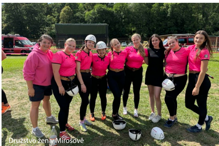
Družstvo žen v Mirošově