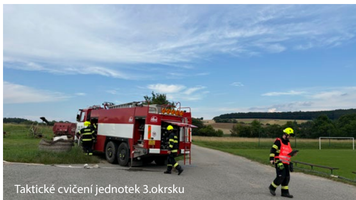
Taktické cvičení jednotek 3.okrsku