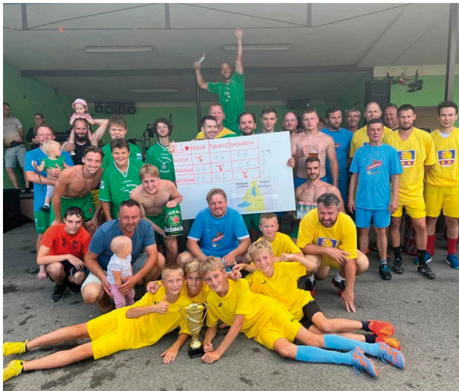
Fotbalistům Rackové brzy začne nová sezóna. Více na straně 14.