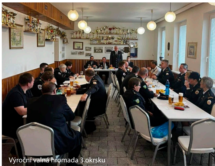
Výroční valná hromada 3.okrsku