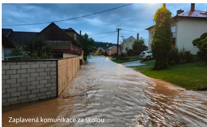
Zaplavená komunikace za školou