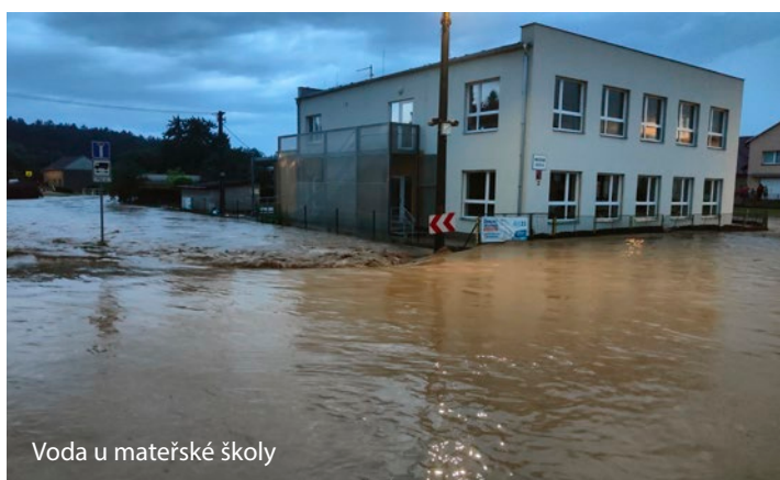
Voda u mateřské školy