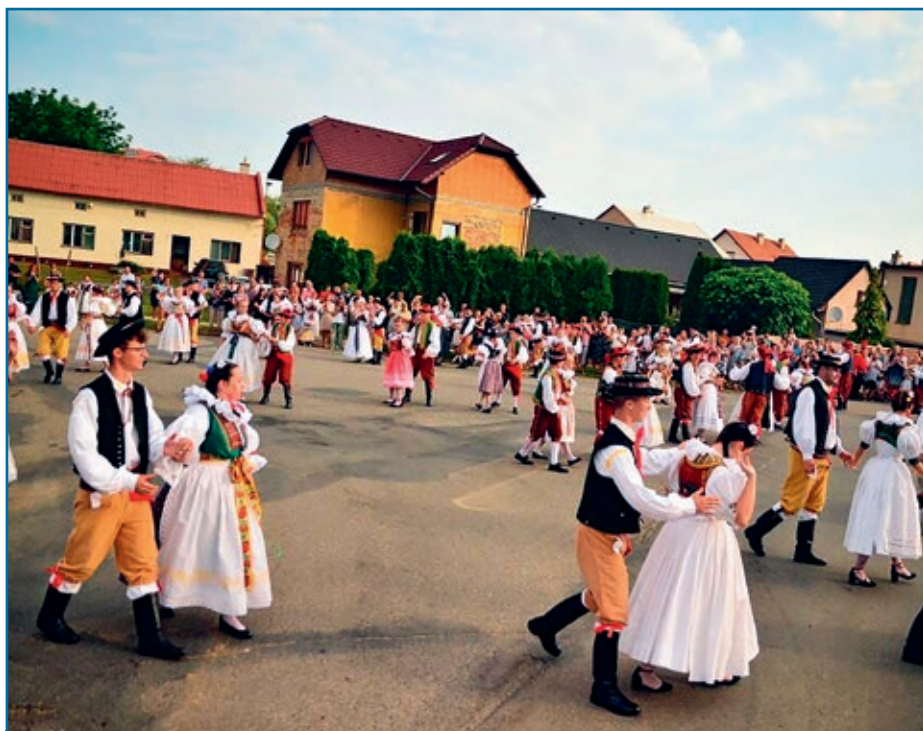
Starý hanácký právo se letos mimořádně konalo po 12 letech. Více na stranách 11 a 12.