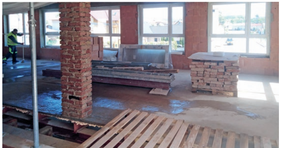
Školka v době rekonstrukce