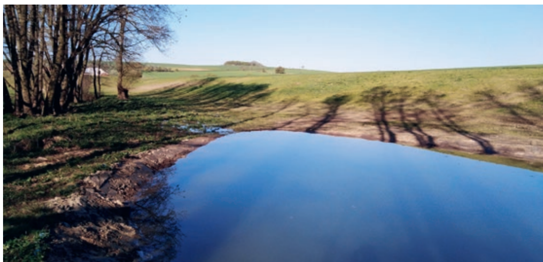
Tůňka číslo 1

Obci se podařilo získat dotaci ve výši 100 % uznatelných nákladů na realizaci mokřadní tůňky Racková. Tůň je v záhytném poldru na pravé straně potoka. Lokalita byla silně podmaččená a nevyužívaná, proto se vedení obce rozhodlo využít místa k vybudování tůňky, která má přirozený přítok ze spodní vody. Vybagrovala se jáma do hloubky cca 1,5 metru o šířce 18 metrů a délce 31 metrů. Plocha hladiny činí 415,9 m 2 . Tůňka neslouží k zadržování ani shromažďování vody, je pouze přirozeným využitím podmaččeného terénu, který by jinak těžko našel uplatnění.