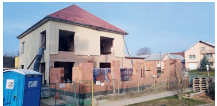
Při pracích budova jako školka vůbec nevypadala.

Podpora obnovy přirozených funkcí krajiny, vybudování 1. tůně v retenčním prostoru poldru – dotace 123 239 Kč, spoluúčast obce 0 Kč – 04/2020